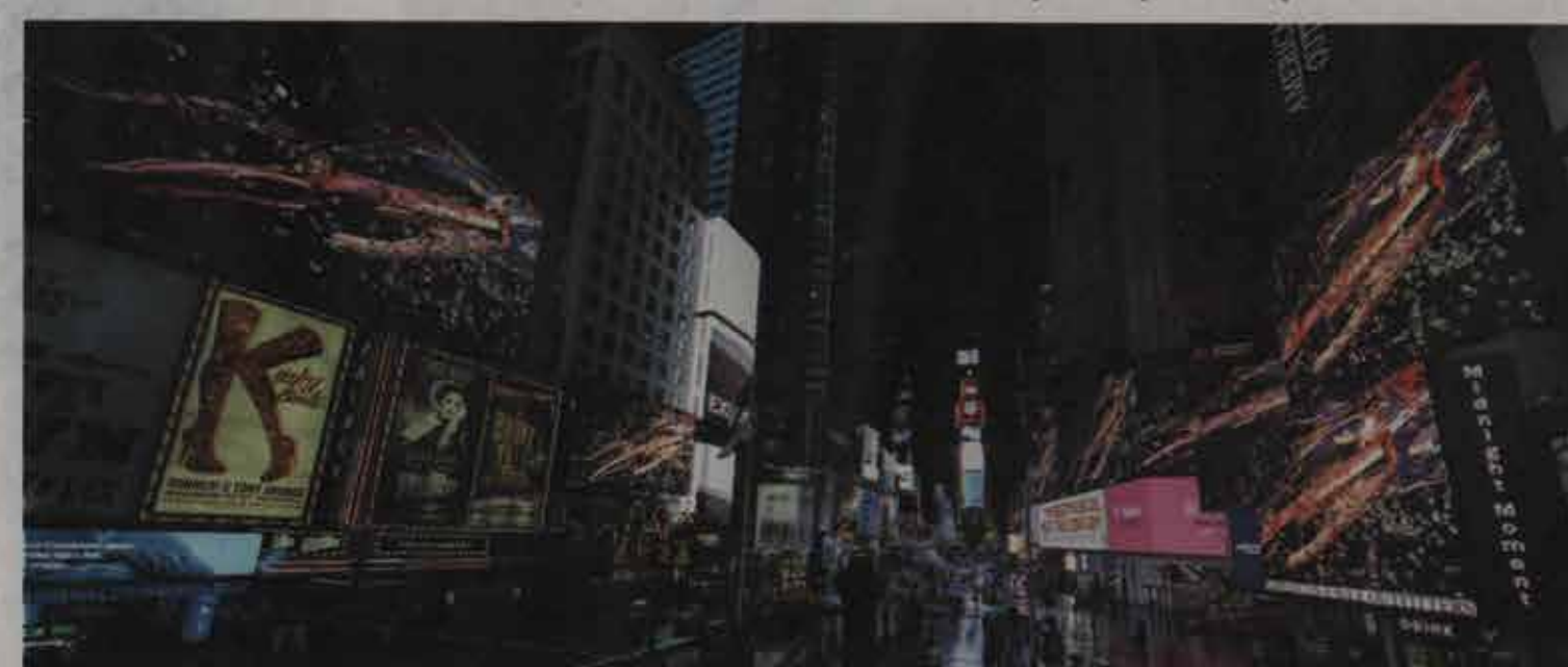
土佐尚子 http://tosa.gsais.kyoto-u.ac.jp/ ニューメディアアーティスト

歴史の中で発見・蓄積されてきた日本美を、先端技術を使って表現する「カルチュラル・コンピューティング」を提唱し、作品制作を行っている。