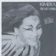
映像アート・ディレクションはハリー・ランバートが手掛けている。

◆情報映像◆ ●「The lost Opera (滅びのオペラ) / キメラ 韓国出身の第一級級の歌姫キメラが、テクノ・インストゥルメンツとロンドン・シンフォニーをミックスして壮大に歌いあげたマシナリー・オペラ。