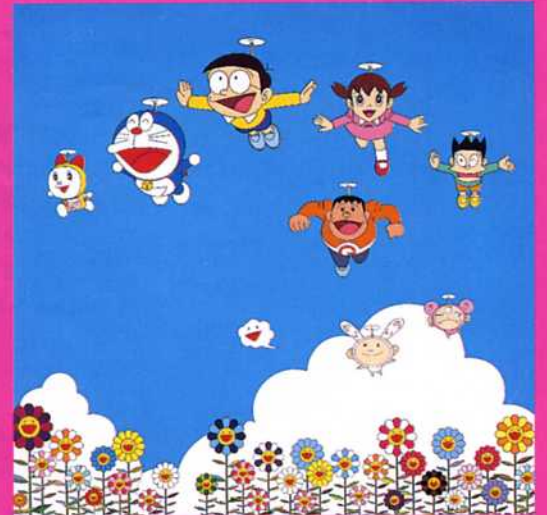
村上隆「ぼくと君とドラえもんの夏休み」