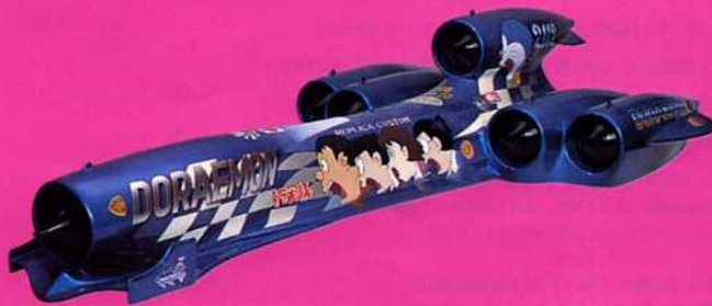
中村晋也「レプリカカスタムドラえもん」